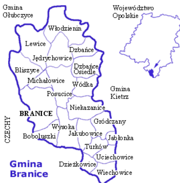
Rys. 1. Lokalizacja Gminy Branice w województwie opolskim